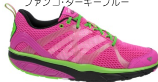
リーシャトレイル ¥25,000 335・336・337W グレー・ベイビーピンク・ブラック