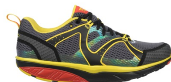
サブトラトレイル ¥25,000 360・361・362M ライム・チャコールグレー・ブラック