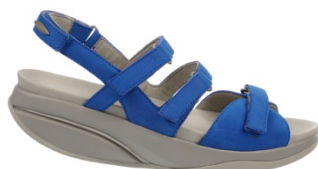
キブリ5 ¥28,000 309・310・311W ブラウン・ターキーブルー・ブラック