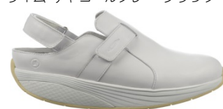
フルアプロフェ ¥27,000 338・339 ホワイト・ブラック

扁平足、外反母趾など、足骨格バランスが悪い方には『スーパーフィートプレミアムインソール』の使用を合わせてお勧めします。