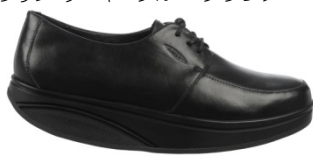
エムアリカ ¥33,000 312W ブラック