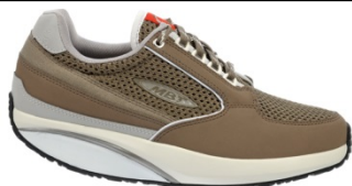
MBT1996 ¥25,000 319・320W ファンゴ・ターキーブルー