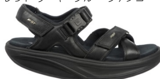
キズム5 ¥29,000 341・342M ホワイト・ブラック