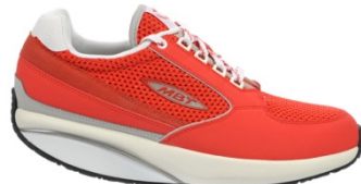
MBT1996 ¥25,000 318・319・320M レッド・ターキーブルー・ファンゴ