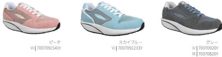
ピーチ W | 7007091541Y