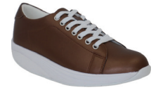
メタリックブラウン W | 3010001