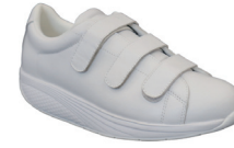
ホワイト M | 2290002