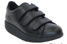
ブラック M | 2290001