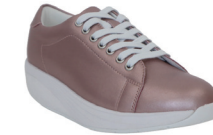
メタリックピンク W | 3010002